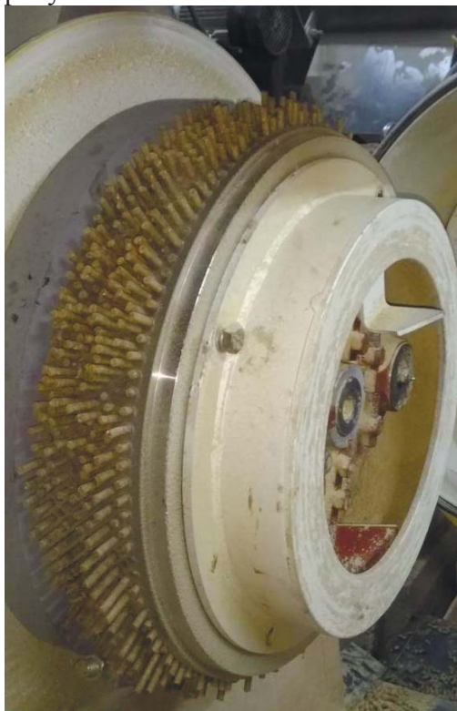
Рисунок 1 - Вихід циліндричної гранули з кільцевої матриці

Геодинаміка процесу полягає у ротаційному русі матеріалу по поверхні матриці, завдяки чому геометрія руху наближається до симетрії обертального шару або сфери. Іншими словами, вона складається з нескінченної кількості вісей симетрії нескінченного порядку. У такій геометрії динаміка процесу сама по собі призводить до того, що сипкий матеріал в перерізі між роликом та матрицею набуває деякої форми: овал, еліпс, сама гранула циліндричної форми (рис.1). З іншого боку, геометрія анізотропії структури матеріалу визначається тертям, деформацією у всіх напрямках, що створює умови для викривлення та зміщення осей симетрії. Однак у всіх випадках впливу геометрії обертального руху та анізотропії структури форма матеріалу наближається до «круглої», за винятком сильно деформованого матеріалу та відповідного отримання гранул.