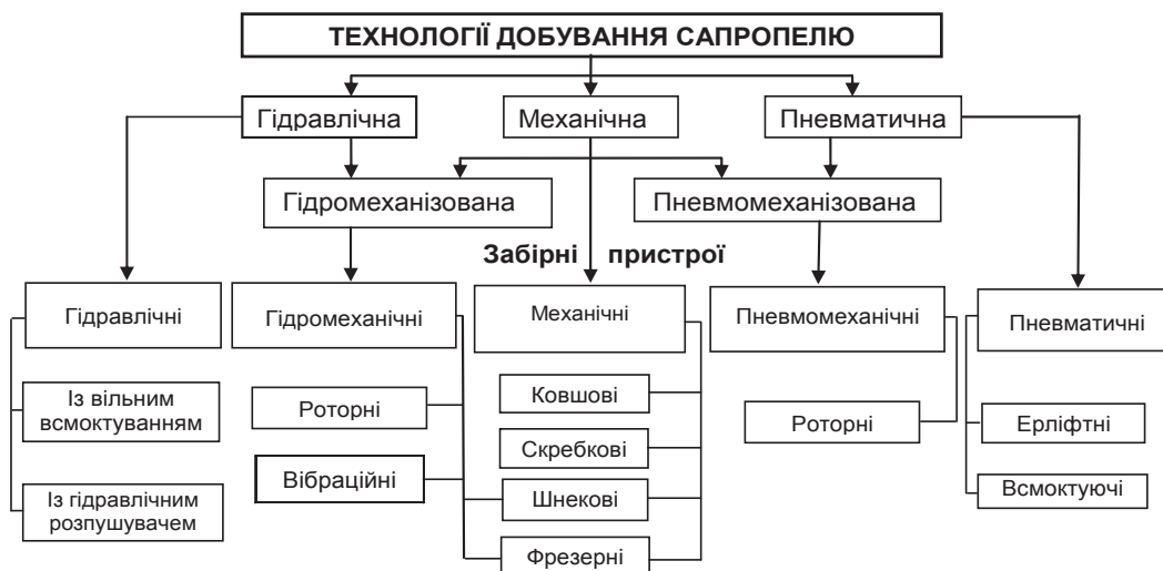
Рисунок 1 – Класифікація технологій добування сапропелів

Аналіз та узагальнення відомих класифікацій технологій добування підводних корисних копалин [1,4, 5, 8-10] показав, що вони базуються на використанні назви робочого органа який є основою засобу для добування покладів. Таке рішення часто спричинює певну плутанину та повторення. Тому нами запропонована класифікація в основу якої покладено тип енергії, що використовується для здійснення видобутку покладів. Також класифікація враховує конструктивні особливості забірної пристрою, який є основою засобу для добування сапропелю (рис. 1).