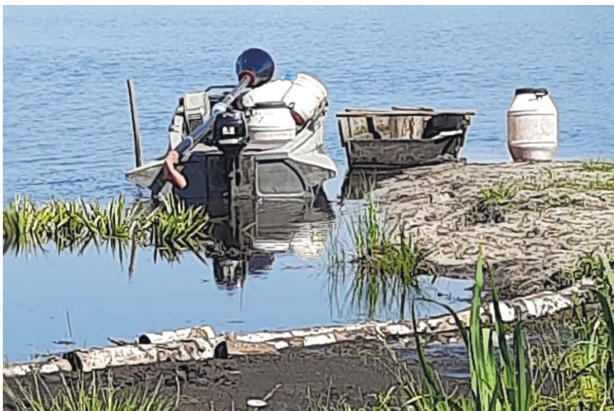
Рисунок 3 – Фото експериментального обладнання перед відплиттям для реалізації дослідження

Для реалізації експерименту за допомогою плавзасобу експериментальне обладнання доставлялось до точки озера, де здійснювались випробування (рис. 3). Далі ПМЗ для добування сапропелю занурювали у шар покладів сапропелю на глибину, визначену довжиною трубопроводу та планом експерименту. Після чого запускали електричний генератор 2 (рис. 2), який застосовувався в якості джерела електричної енергії, та компресор 3. У ресивері компресора створювали тиск повітря у P=800 кПа. Далі шляхом відкриття клапана компресора, забезпечували подачу стисненого повітря до робочого органа через трубопровід б під тиском, встановленим планом експерименту. При цьому компресор працював постійно. В процесі виходу повітря із приводних форсунок здійснювався обертовий рух розпушувача та його взаємодія із сапропелем, який розташований перед вхідним вікном кінцевого корпусу. Повітря, що виходило із робочих форсунок забезпечувало розпушення сапропелю, його подавання у порожнину підіймального трубопроводу та транспортувався до надводної поверхні. Повітря, що виходило із приводних форсунок, забезпечувало привод механічного розпушувача і у подальшому об'єднувалось із повітрям, що надходило із робочих форсунок.